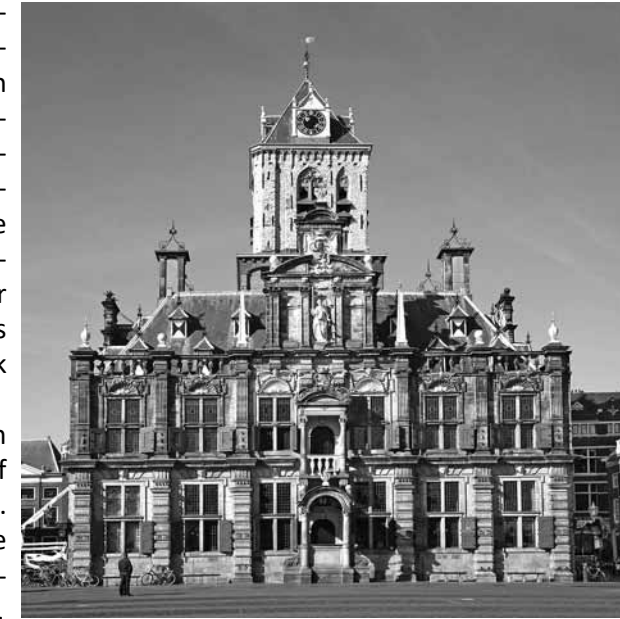
Rathaus von Delft

wusch und schnitt sich die Haare lieber selber - kurz bevor sie zum prächtigen mittelalterlichen Saal des Delfter Standesamtes ging. Danach fand die kirchliche Hochzeit in einer