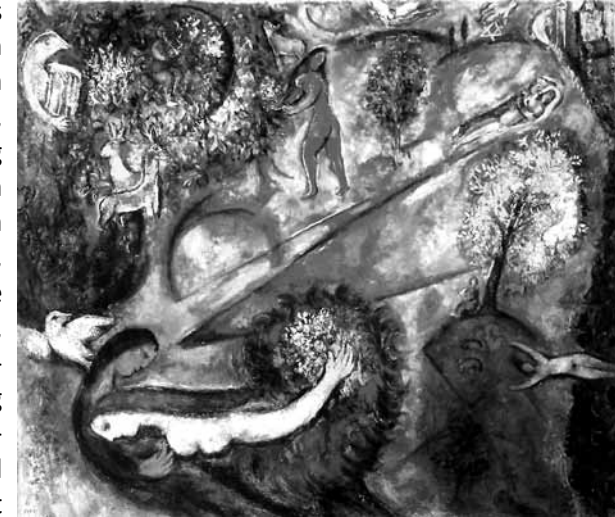
Marc Chagall: Hohelied I

Jetzt könnt ihr fragen: warum stehen diese Liebeslieder überhaupt in der Bibel? Dieses Liederbuch muss doch gerade für Christen, die sexuell enthaltsam leben oder die sich entschieden haben, der Sexualität keinen so großen Raum einzuräumen, eine ziemliche Provokation sein! Das Hohelied ist deshalb in der Bibel, weil man es zu der Zeit, als der Kanon der biblischen Bücher entstand, allegorisch (bildlich) verstanden hat: Man war der Meinung, die Lieder sprechen eigentlich von der Liebe zwischen Christus und der Kirche. Oder zwischen Christus und der gläubigen