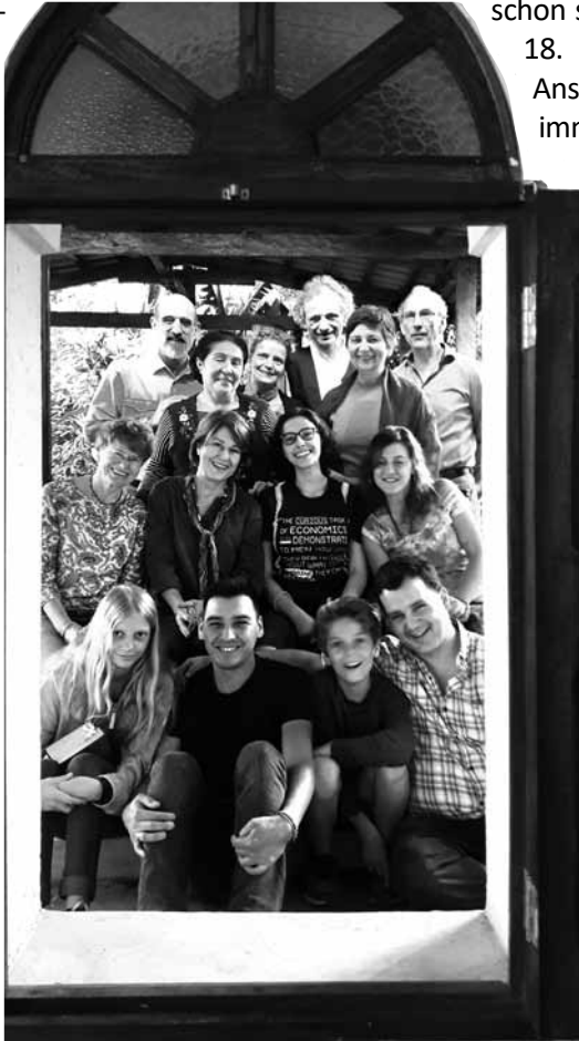
Auf dem Retiro.

Eine angenehme Lektüre wünscht Ihnen und Euch Katrin Neuhaus , am 1. April 2018