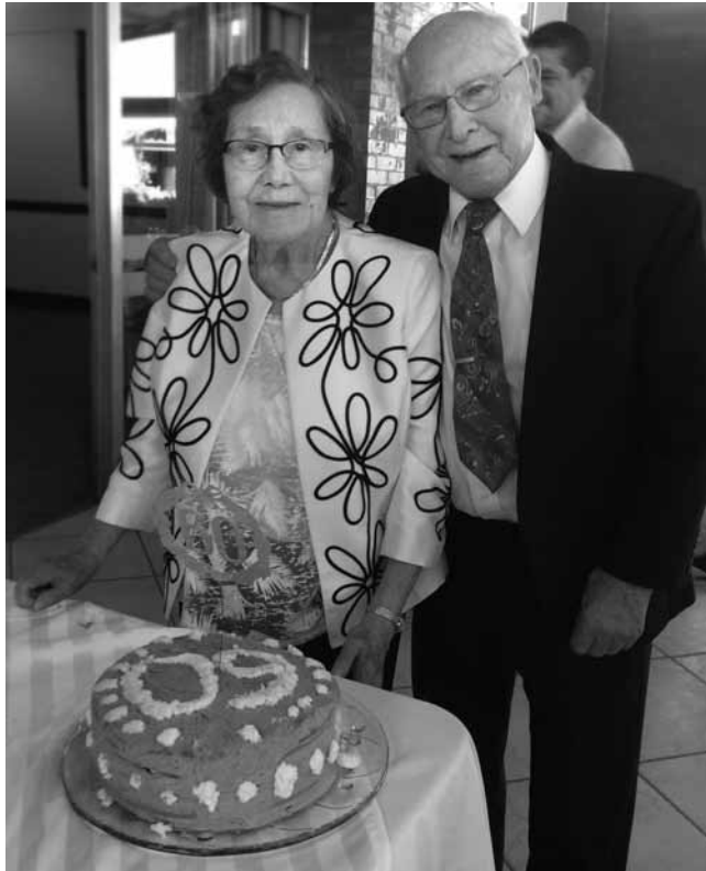
Vermieterin (links), Untermieter (rechts)