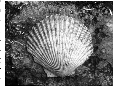
Jakobsmuschel auf dem Retiro 2018 in Ataco

Komm, sag es allen weiter, ruf es in jedes Haus hinein! , heißt ein bekanntes Kirchenlied. Als Petrus und Johannes vor den Ältesten und Hohepriestern erscheinen mussten, sagten sie, sie könnten nicht anders als von den Dingen reden, die sie gesehen und gehört hätten. Ja, so gesehen ist die Aufforderung Jesu eigentlich überflüssig. Scheint es zumindest, aber wer jemanden sendet, der tut es meist aus guten Gründen. Jesus weiß um den „Zahn der Zeit“, der