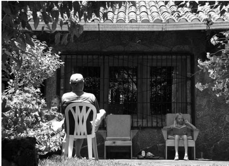
Pasanaí mit Gästen