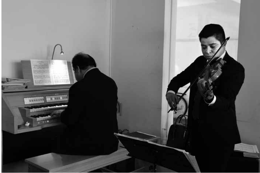
Das erste Orgelkonzert in der Epiphanius-Gemeinde

tag, bei jedem Fest, in jeder Andacht und jedem Konzert die Orgel (der Firma Kisselbach) erklingen, und wir sind sehr froh darüber. Und danken Ihnen, liebe Gemeinde in Wolgast,