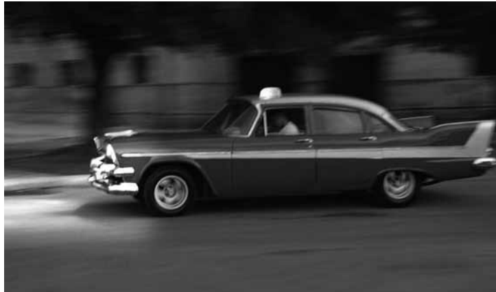
Nachts mit dem Chevrolet durch Havanna

– Hat man euch auf der Straße Zigarren angeboten?